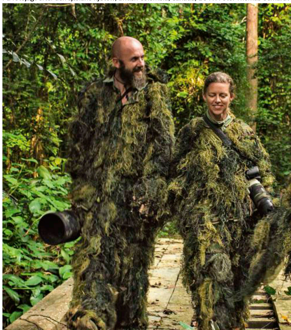
Fotografering af vilde mandriller iført "Chewbacca"-dragter i Gabon, 2016.