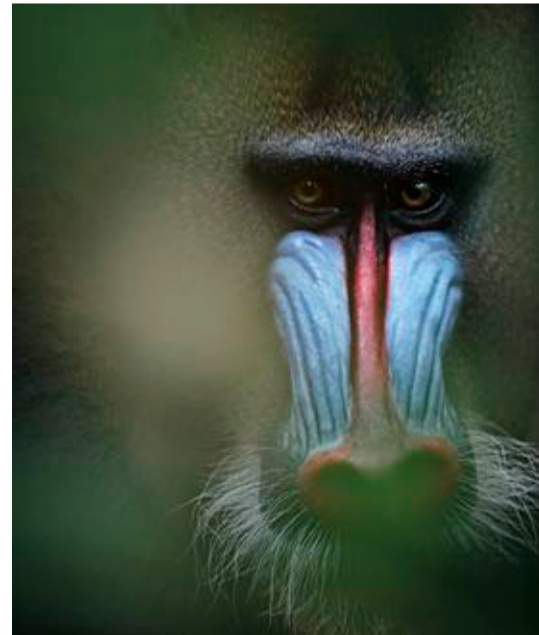
Uri og Helle Løvevild Golman var blandt de første fotografer i verden til at fotografere vilde mandriller. Gabon, 2016.