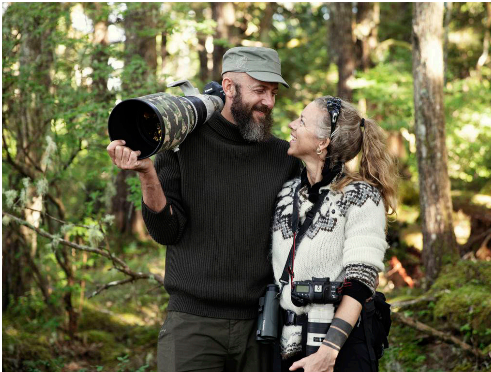
På fotojagt efter den sjældne kystulv, British Columbia, Canada, 2017.