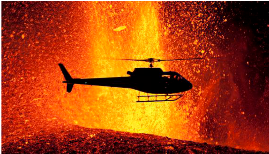
Uri Løvevild Golmans billede af Eyjafjallajökull i udbrud kom i 2011 på forsiden af National Geographic.