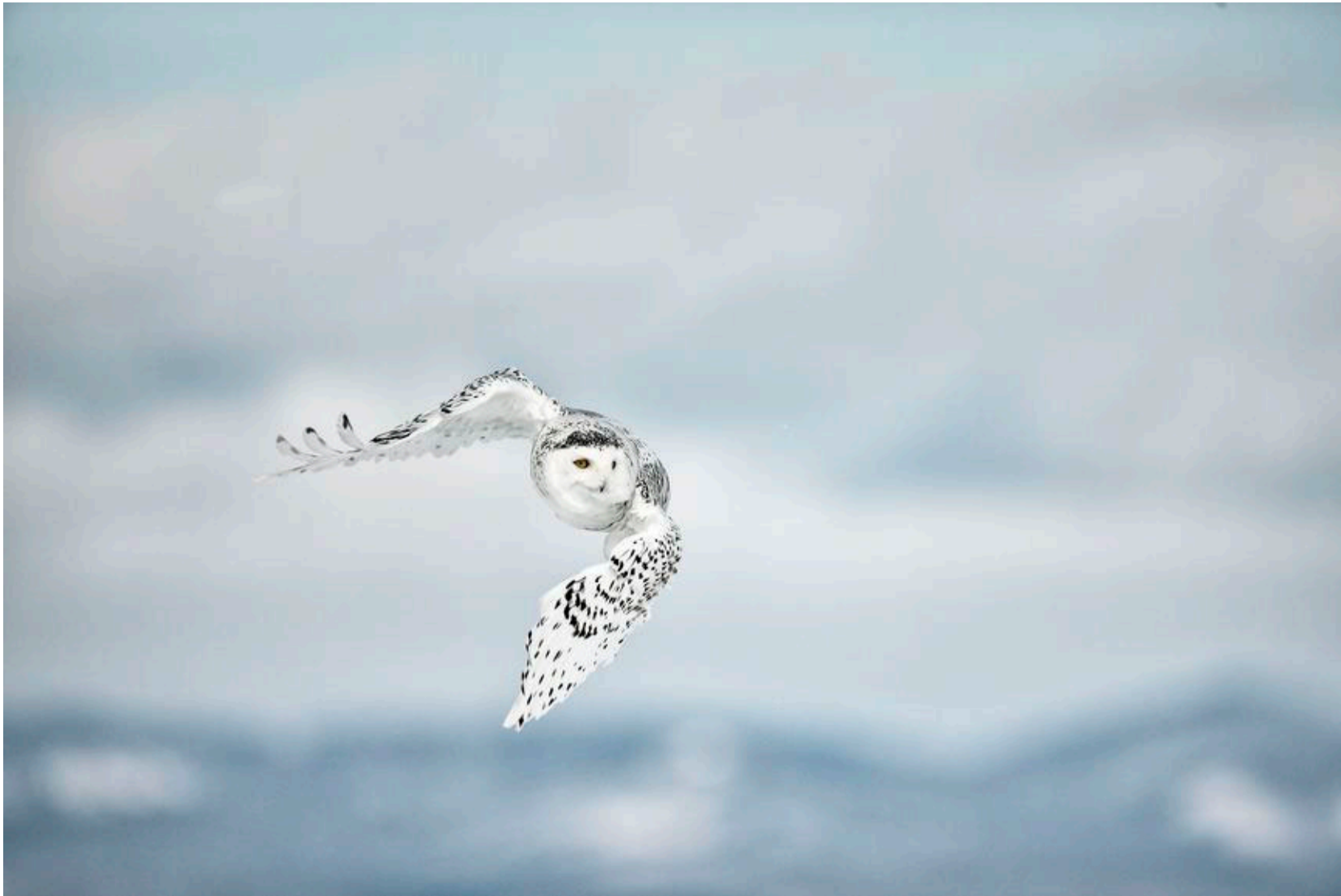
Sneuglen i flugt over Canada i 2010 er Uri Løvevild Golmans måske mest ikoniske billede. I skovhuset hænger en fjer fra en sneugle som Uri gav Helle på deres første ekspedition.